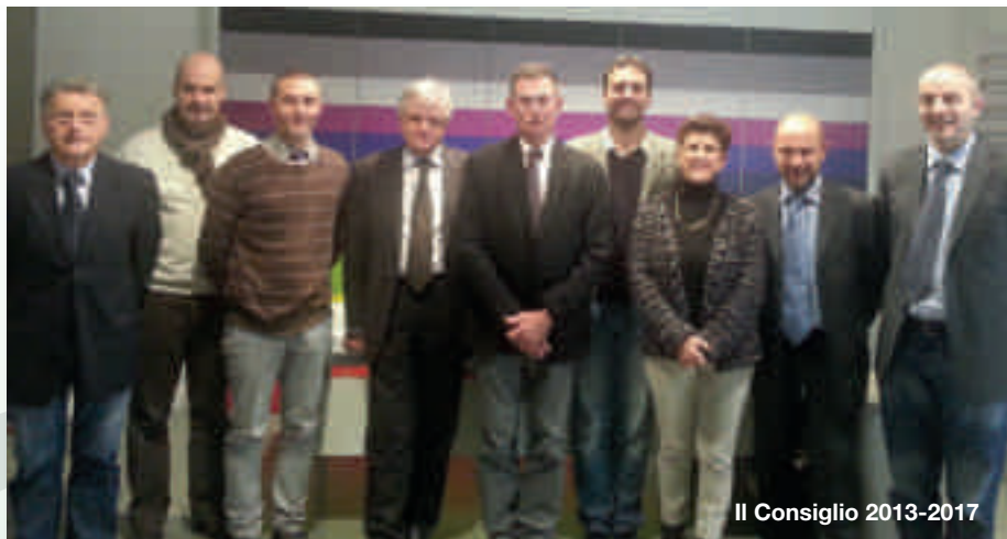
Il Consiglio 2013-2017